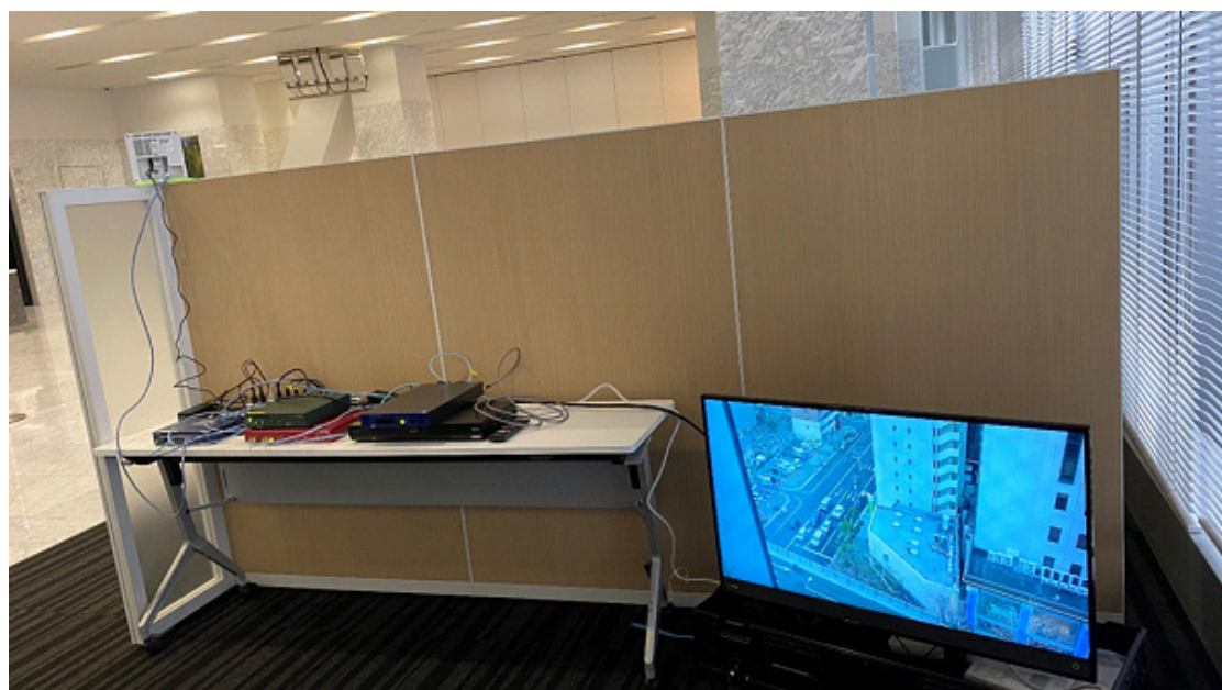
ドコモ関西支社（左上奥がドコモ 5G 基地局 左上手前が 5G データ端末）