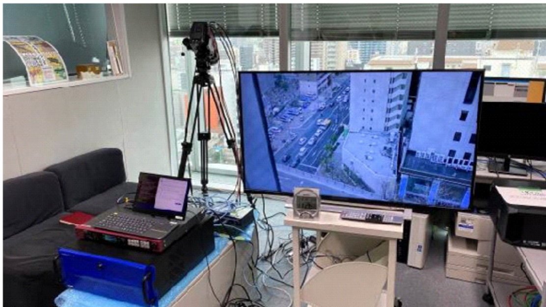
MBS 毎日放送本社（左下前面青い機器が 8K HEVC エンコーダー）