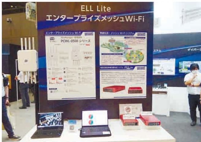
エンタープライズメッシュWi-FiとELL Liteの展示コーナー

「CATV事業者のエリ ア内で、通信サービスの 利用につなげる一環とし て提案できる。キャンプ 場は今はやっているが、 Wi-Fiが使えること でキャンプ場価値も上が る。また、災害時の避難 所向けに、一時的に人が 集まり過ぎても使える回 線として提供することも 考えられる。今回展示し たことでニーズを捉えら れた」と話した。