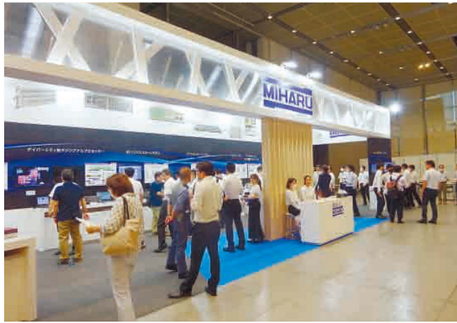
ミハル通信ブース